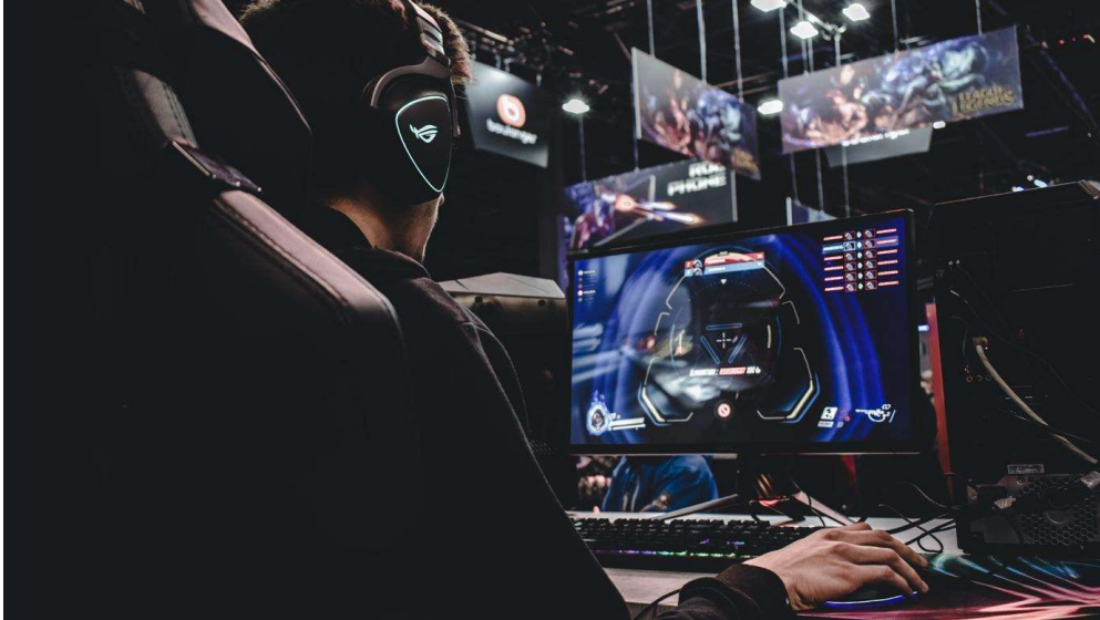
Im einzigartigen Setting der Salzburgarena werden neben internationalen Profi-Wettkämpfen auch eSport-Turniere ausgetragen, für die sich jeder Besucher im Vorfeld anmelden kann.

In den Side Areas kommen sowohl aktive Zocker als auch passive Genießer voll auf ihre Kosten. Hier tauchen die Besucher an Keyboard, Controller und Smartphone in die Welten der topaktuellsten Spiele ein und messen sich mit ihren Freunden. Independent-Game-Entwickler geben Fans exklusive Einblicke in ihre Arbeit, während im eigenen Outdoor Networking Bereich die Möglichkeit besteht, sich über die Trends der Branche auszutauschen.